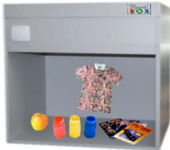
Különböző felhasználási területek